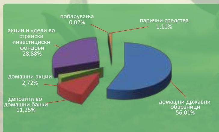
Структура на портфолиото на КБ Прв отворен доброволен пензиски фонд - Скопје по групи на инструменти