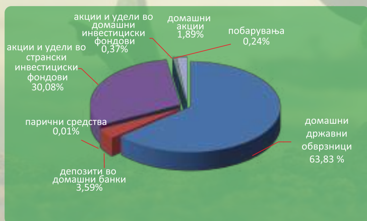
Структура на портфолиото на КБ Прв отворен задолжителен пензиски фонд - Скопје по групи на инструменти