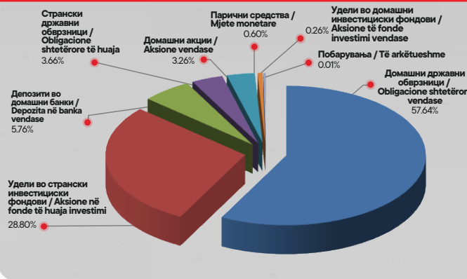
Структура на портфолиото на КБ Прв отворен доброволен пензиски фонд – Скопје по групи на инструменти / Struktura e portofolit në KB Fondi i parë i hapur vullnetar pensional - Shkup sipas grupeve dhe instrumenteve