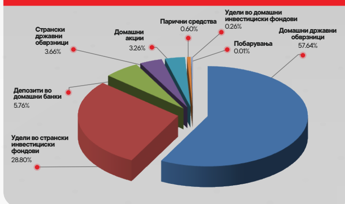
Структура на портфолиото на КБ Прв отворен доброволен пензиски фонд - Скопје по групи на инструменти