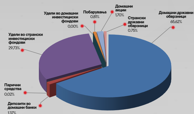
Структура на портфолиото на КБ Прв отворен задолжителен пензиски фонд - Скопје по групи на инструменти