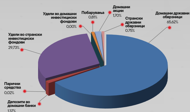
Структура на портфолиото на КБ Прв отворен задолжителен пензиски фонд - Скопје по групи на инструменти